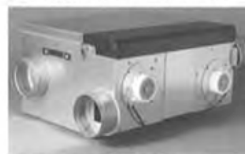
①熱交換型換気装置「澄家DC-S」